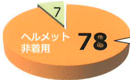
【過去5年】 自転車乗用中死者のヘルメットの有無